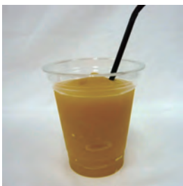
マンゴーフロースン