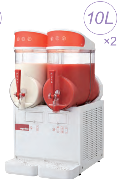
MT-2 ¥ 450,000 (税別)