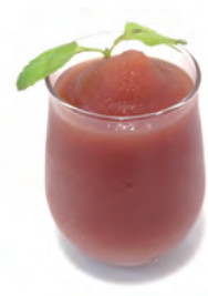
サングリアフロースン