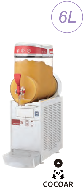
mini-1 ¥ 220,000 (税別)

簡単レシピで美味しいフロースンドリンク&カクテルが作れます スイッチ切替で、ドリンクディスペンサーとしてもお使い頂けます。コンパクトな6Lタイプとレギュラー10Lタイプをご用意しました。