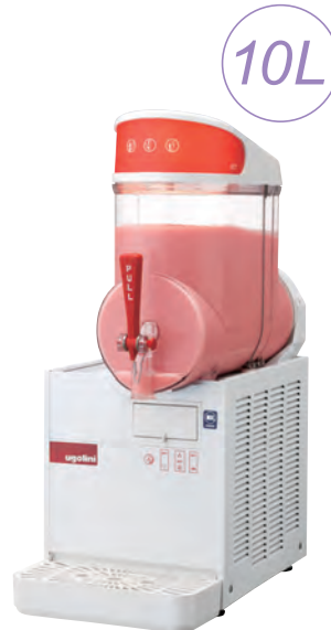
MT-1 ¥ 350,000 (税別)