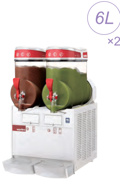
mini-2 ¥ 330,000 (税別)